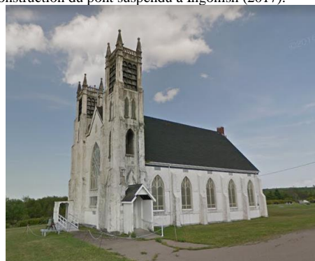
L'église en pierre à Victoria Mines (2017).