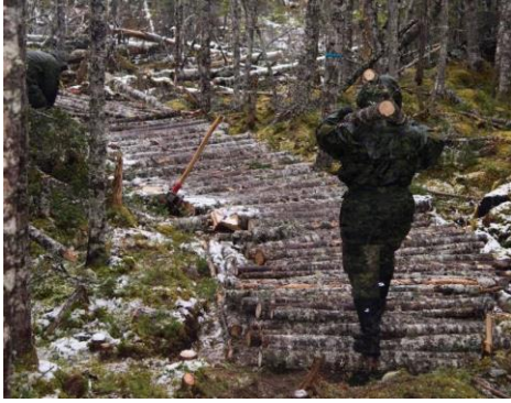
Assainissement du sentier du siège près de Fort Louisbourg (2017).

Le 11 novembre, jour du Souvenir, le régiment a eu l'honneur de participer à la cérémonie à Sydney au terme de laquelle la troupe de maintenance a passé quelque temps dans la branche locale 138 de la légion où nous avons parlé avec les vétérans de leur expérience comme militaire.