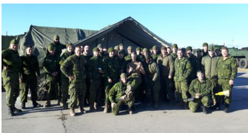
Trp de maint de l'Ex NhS Sydney, Cap-Breton (2017).

L'année 2017 a été remplie de moments excitants pour les membres de la troupe de maintenance du 4 e RAP. Elle a commencé par une intervention au moment de la tempête de verglas dans le nord du Nouveau-Brunswick en janvier. Les membres de la troupe ont été déployés pour appuyer la flotte du régiment utilisé pour dégager les routes, élaguer les arbres et aider les Canadiens de la région. Le personnel de la troupe a assumé diligemment ses responsabilités en maintenant l'équipement en bon état de fonctionnement pour exécuter cette tâche très importante.